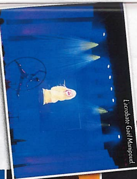
L'acrobate Gaëll Manipoud.